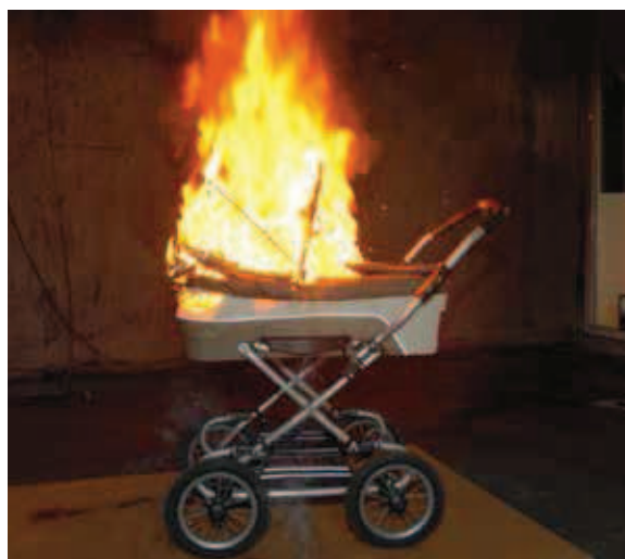
Håll trapphuset fritt från brännbart material och sådant som är i vägen vid en utrymning.

uthyrningen är det lämpligt att den som hyr ut lokalen för en dialog med hyresgästen om hur brandskyddet är tänkt att fungera när det gäller utrymningsvägar, tillåtet antal personer, eventuella larm med mera. I vissa fall kan det också vara lämpligt att tillsammans gå igenom lokalen/lokalerna innan de tas i bruk för arrangemanget. Det bör också finnas någon form av skriftlig brandskyddsinformation och checklista till hyresgästen. Sådana bör också vara uppsatta i lokalen.