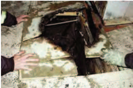
Felaktigt hanterad aska är en vanlig brandorsak. Här har golvet brunnit när aska från en kakelugn som det eldats i dagen före ställts i en plastpåse på golvet.

Bränder i bostäder är ofta eldstadsrelaterade. Därför är det viktigt att uppmärksamma säkerheten kring eldstäder. De boende behöver informeras om vad som gäller för de lokala eldstäder som finns i fastigheten, exempelvis kakelugnar och öppna spisar. Viktig information är om det får eldas i dessa, vad som i så fall får eldas, i vilken omfattning det får eldas och hur askan ska hanteras.