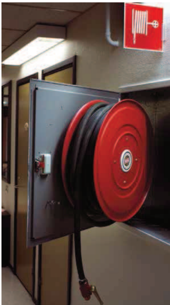
En vattenslang i styv plast är lätt att hantera och finns alltid på plats.