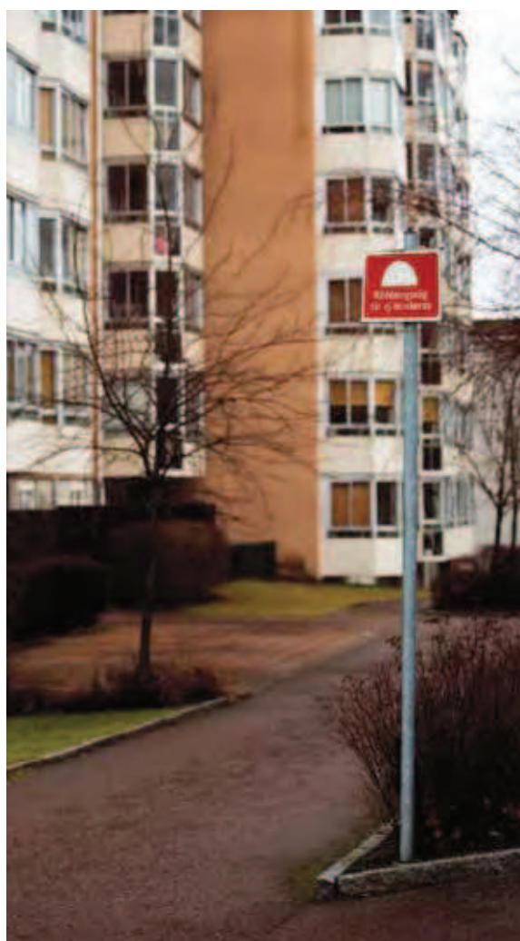
Räddningsvägar ska hållas snöröjda och fria från andra hinder.

Garage förses lämpligast med pulversläckare eftersom pulver är effektivt mot motorbränder. En sådan fungerar på de flesta typer av bränder och kan användas även för övriga utrymmen. Handbrandsläckare riskerar att bli stulna. Vill man ha släckutrustning i allmänna utrymmen kan vattenslang på rulle i ett fast skåp vara ett bra alternativ.